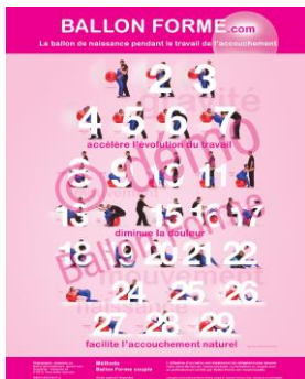
Grande affiche CHF 30.- 20 affichettes CHF 30.-