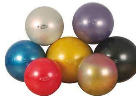
Ballons 55cm CHF 32.- 65cm CHF 35.-