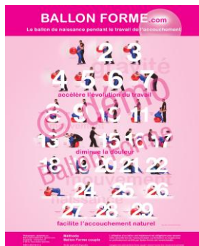
Grande affiche CHF 30.- 20 affichettes CHF 30.-